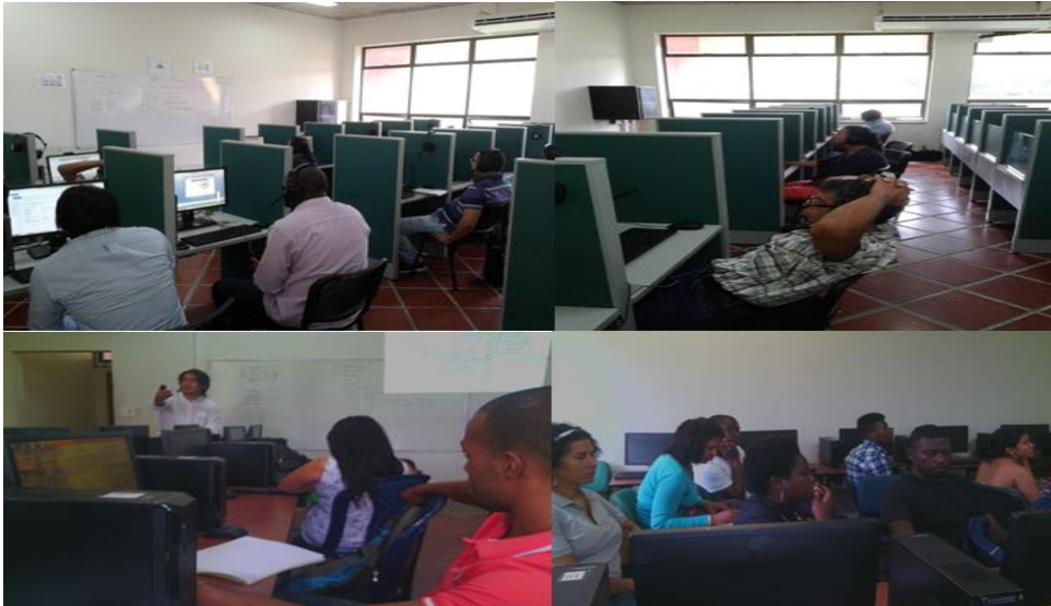
Imagen 3: Formación de Usuarios, docentes y estudiantes de trabajo de grado