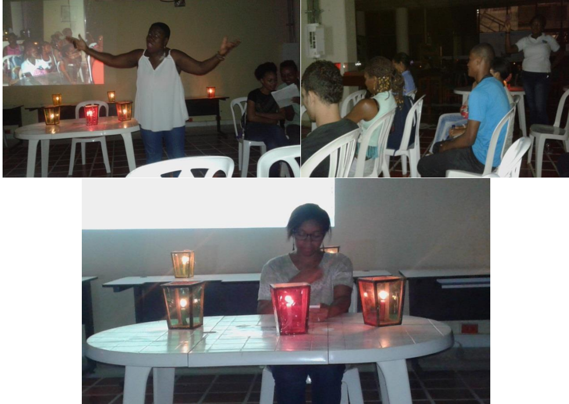
Imagen 2: Recital poetas Universitarios