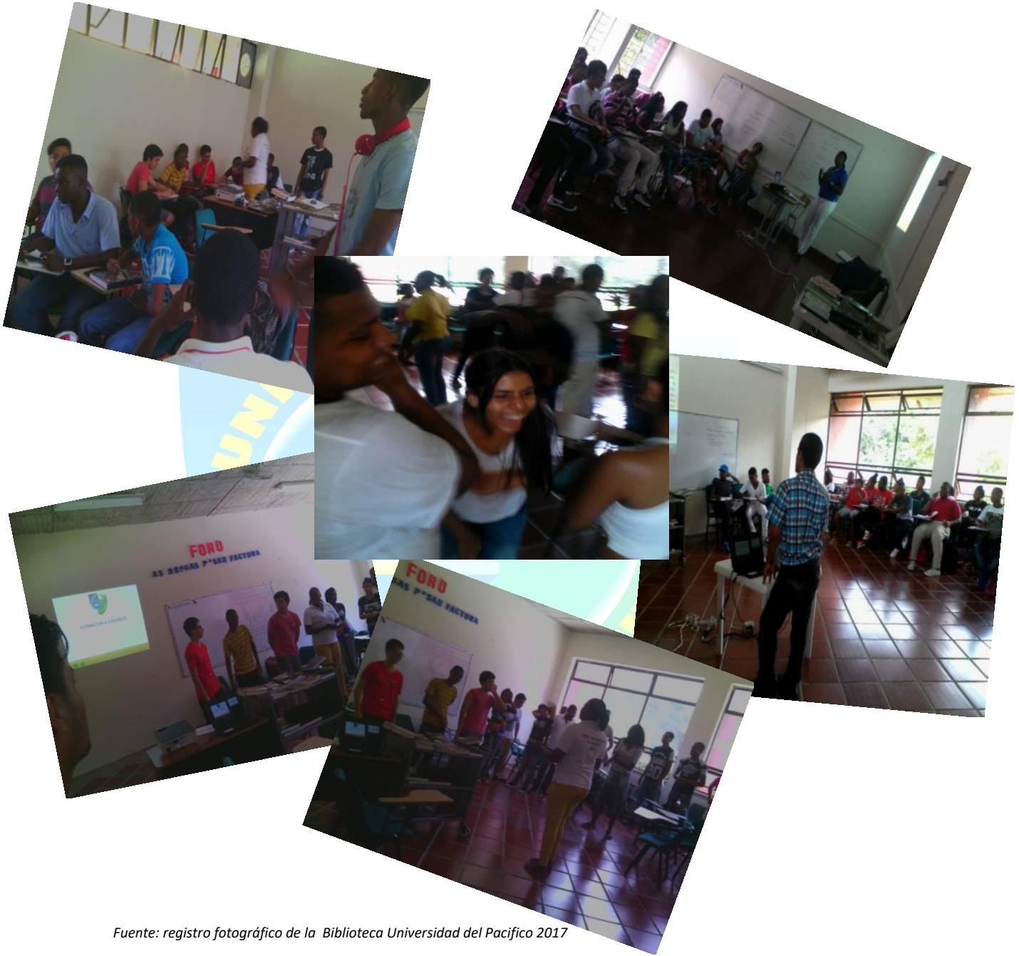
Imagen 3: Formación a usuarios.