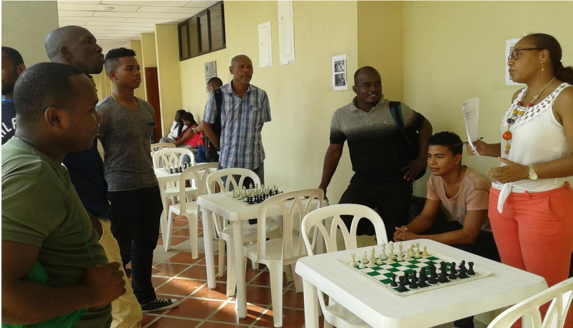
Imagen 11: Inauguración del concurso.