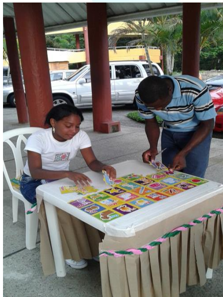
Imagen 14: Actividad vuelve a armar el abecedario.