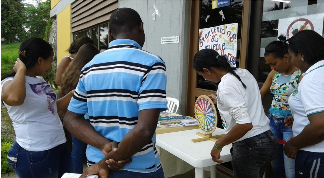
Imagen 13: Ruleta de la fortuna.