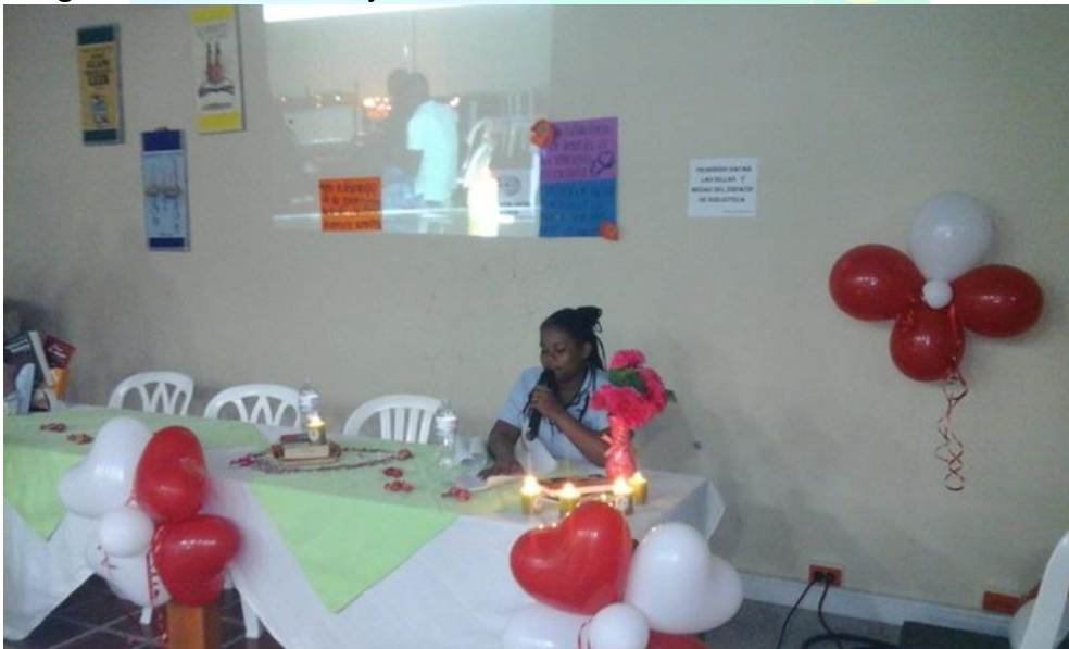
Imagen 10: Concurso de ajedrez.