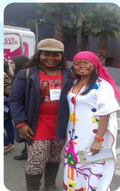
Imagen 16: Expositores y asistentes.

Las mujeres ex-combatientes se preguntan por el cómo construir historia, cómo volver ese testimonio de vida memoria? La historia se escribe para recoger la complejidad de lo vivido en tiempo de guerra, y como hoy se pretende hacer una aceptación de lo vivido.