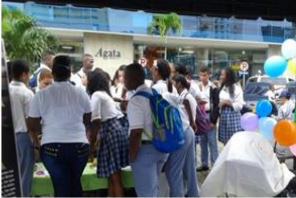
Imagen 5: La lectura se toma el Boulevard.