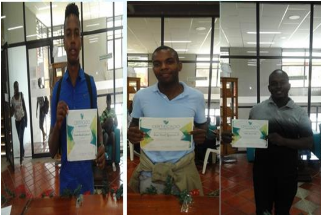
Imagen 12: Entrega de certificados a los participantes.