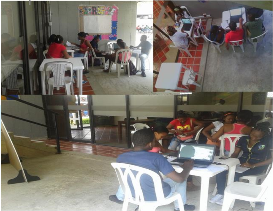
Imagen 7: Espacio debajo de las escaleras.