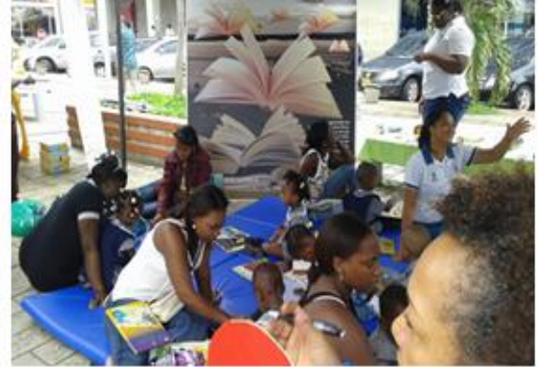
Atendiendo a los niños con la maleta con los elementos del Pacífico