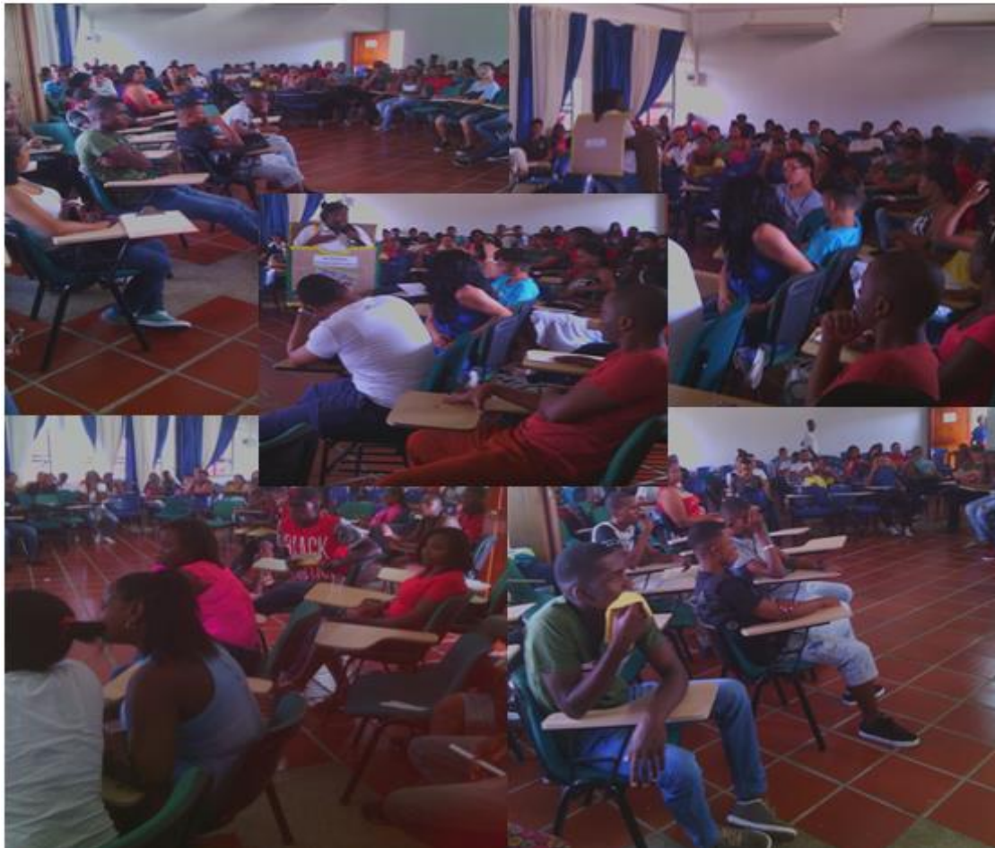
Imagen 1: Presentación de los servicios de biblioteca.