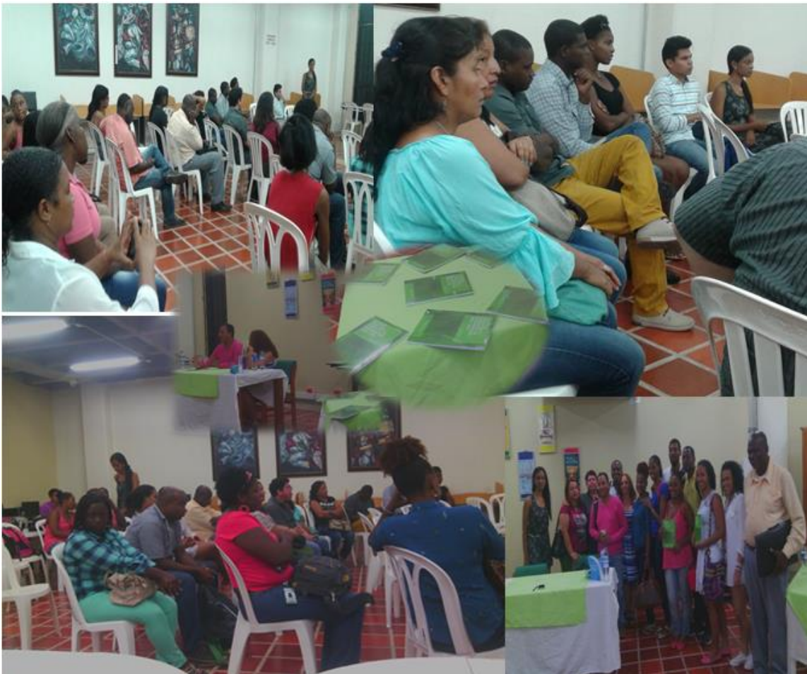
Imagen 8: Lanzamiento del libro Acciones Colectivas 2008 – 2012.