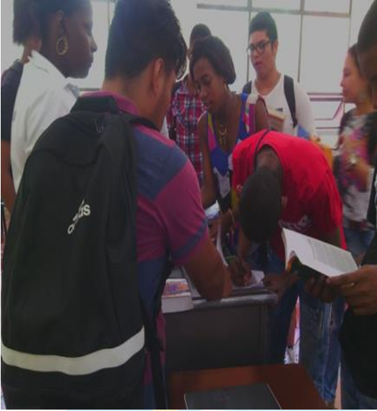
Imagen 4: Fomento a la lectura.