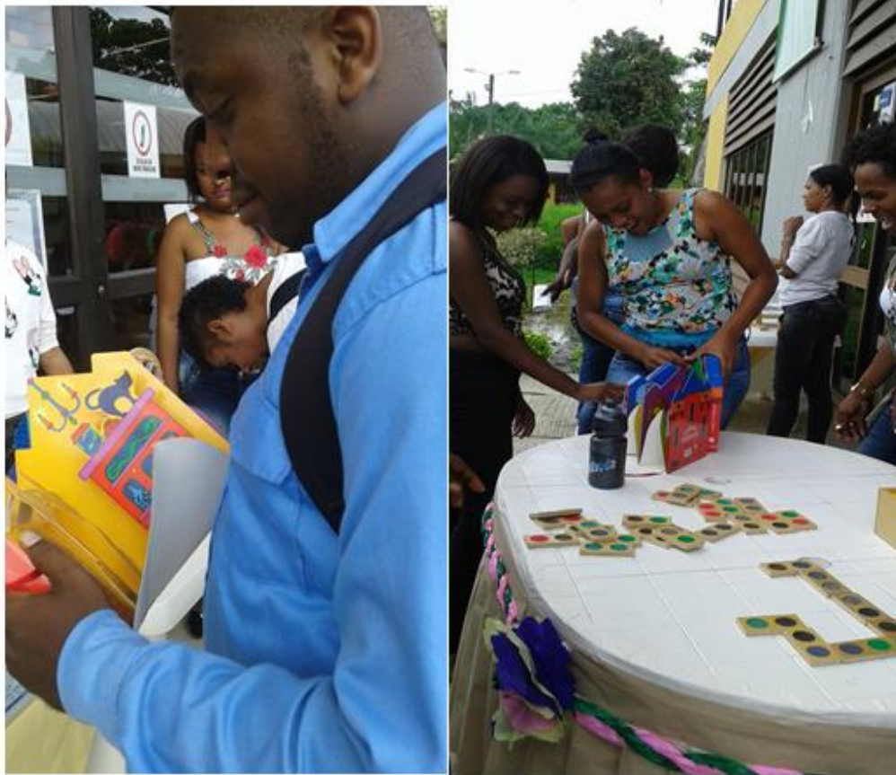
Imagen 15: Actividad cuéntame una historia con lo que ves.