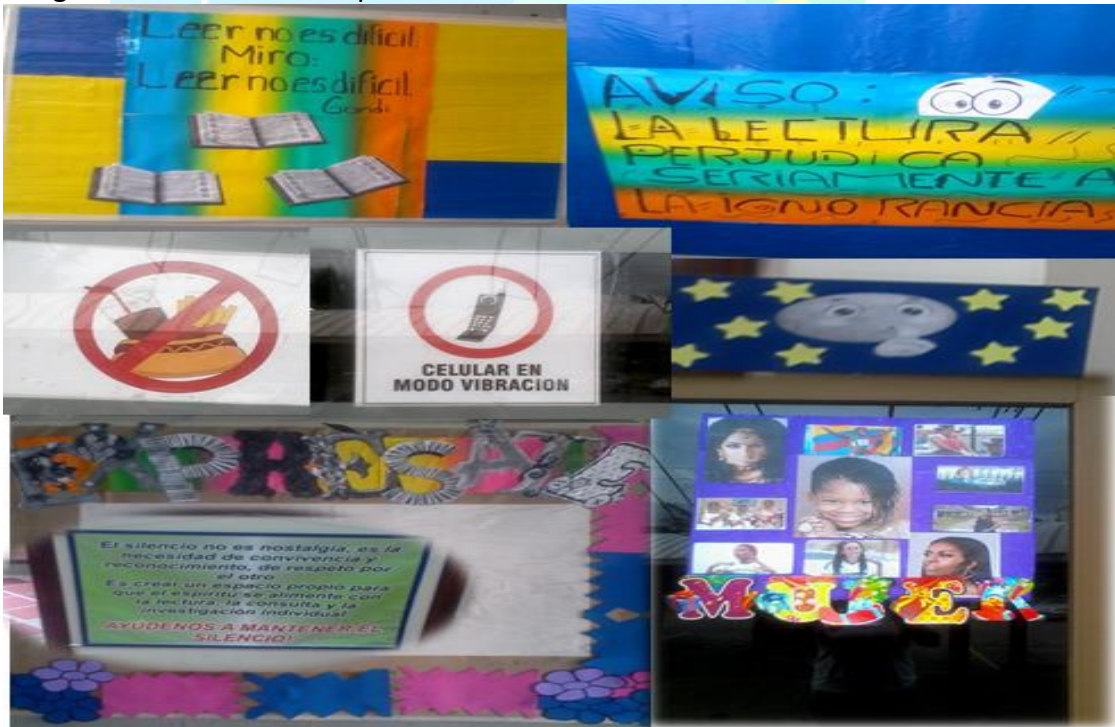
Imagen 6: Ambientación espacio infantil Biblioteca.