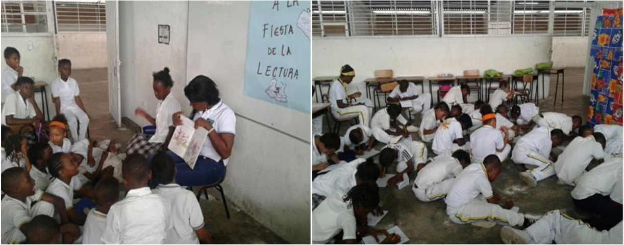
Imagen 1: El Fomento de la Lectura desde temprana Edad (fiesta de la lectura)